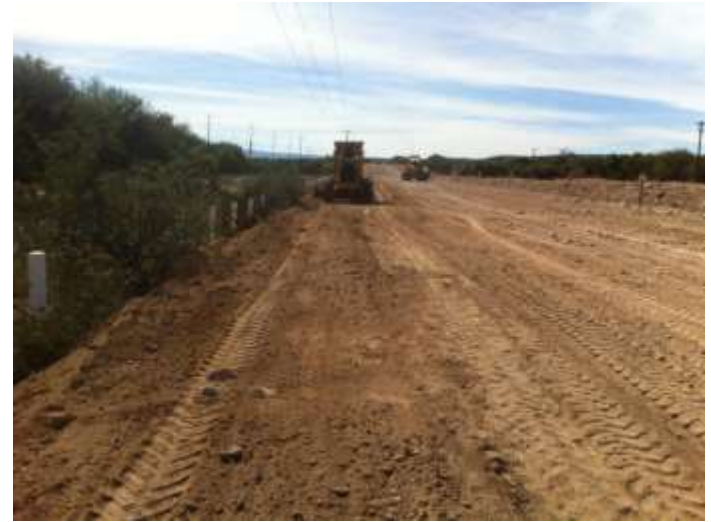
FORMACION DE TERRAPLEN KM 244+400