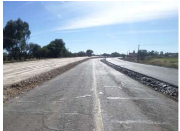
CADENAMIENTO 254+360 VISTA A TEPETONGO