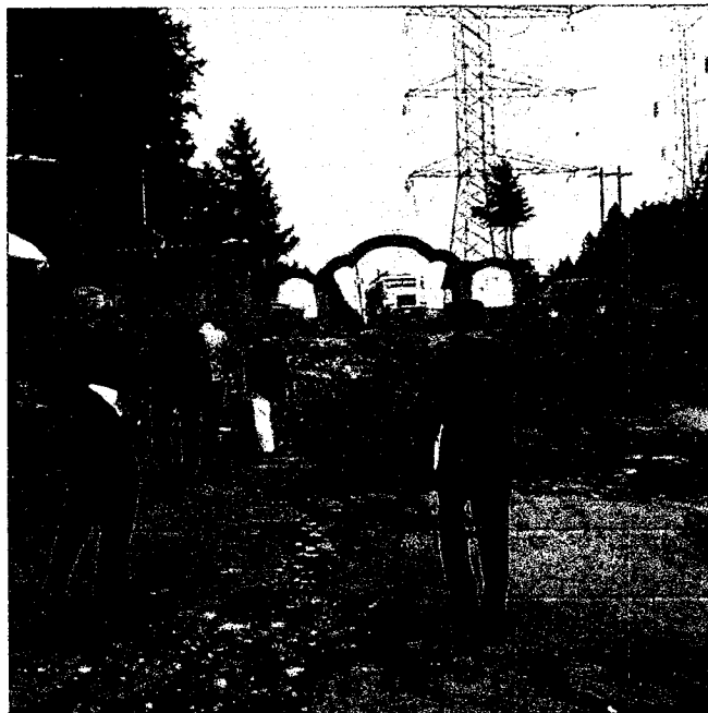
Zona cercana al Inicio del Túnel Tramo México-Toluca